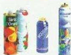
Aérosols et bidons