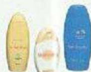
Flacons de produits de toilette