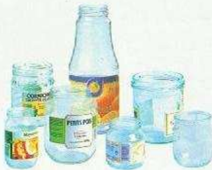
Les pots et bocaux de conserves

Je les mets en vrac, pas en sac, dans le conteneur à bandes vertes