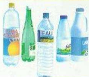
Bouteilles d'eau, de jus de fruit, de soda, de lait...