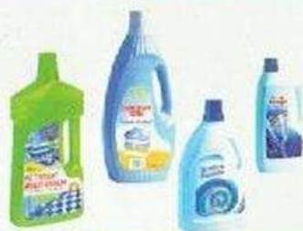
Flacons de produits ménagers (javel, liquide lave-vaisselle, lessive...)