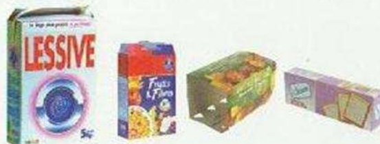
Boîtes et sur-emballages en carton