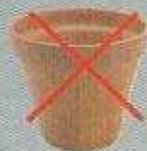
Pots de fleurs

Un doute ? Jetez dans votre poubelle habituelle