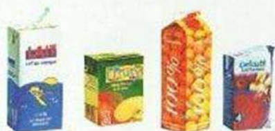
Briques alimentaires (lait, jus de fruit, soupe,...)