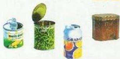
Boîtes de gâteaux, de conserve... et boîtes de boisson