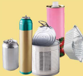
BOÎTES et EMBALLAGES MÉTALLIQUES