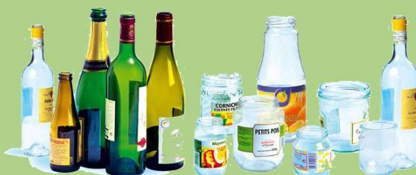
POTS EN VERRE