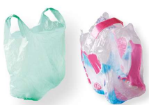
SACS, SACHETS et FILMS EN PLASTIQUE